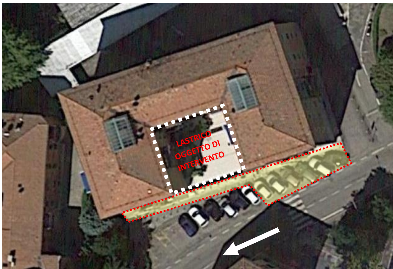
Foto aerea per inquadramento area di occupazione